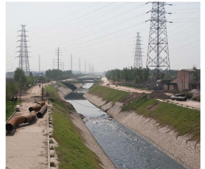
Åben kloak uden for Xian. Kina er ved at løbe tør for rent vand. Nu vil de hente vand fra det østlige Rusland. Billedet er taget i 2007.

Igen skulle vi jo passere gennem byer og landskaber. Lige uden for Xian stoppede vi ved en kanal for at se på forholdene. Det viste sig at være en åben kloak fra fem millioner indbyggere, en stinkende svovlpøl. Et andet sted var floden helt rød med skum.